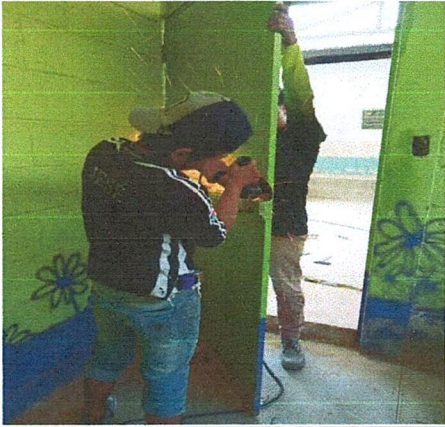
Foto 1: REALIZACIÓN DE TRABAJOS EN COLOCACIÓN DE CHAPAZ EN PUERTAS.